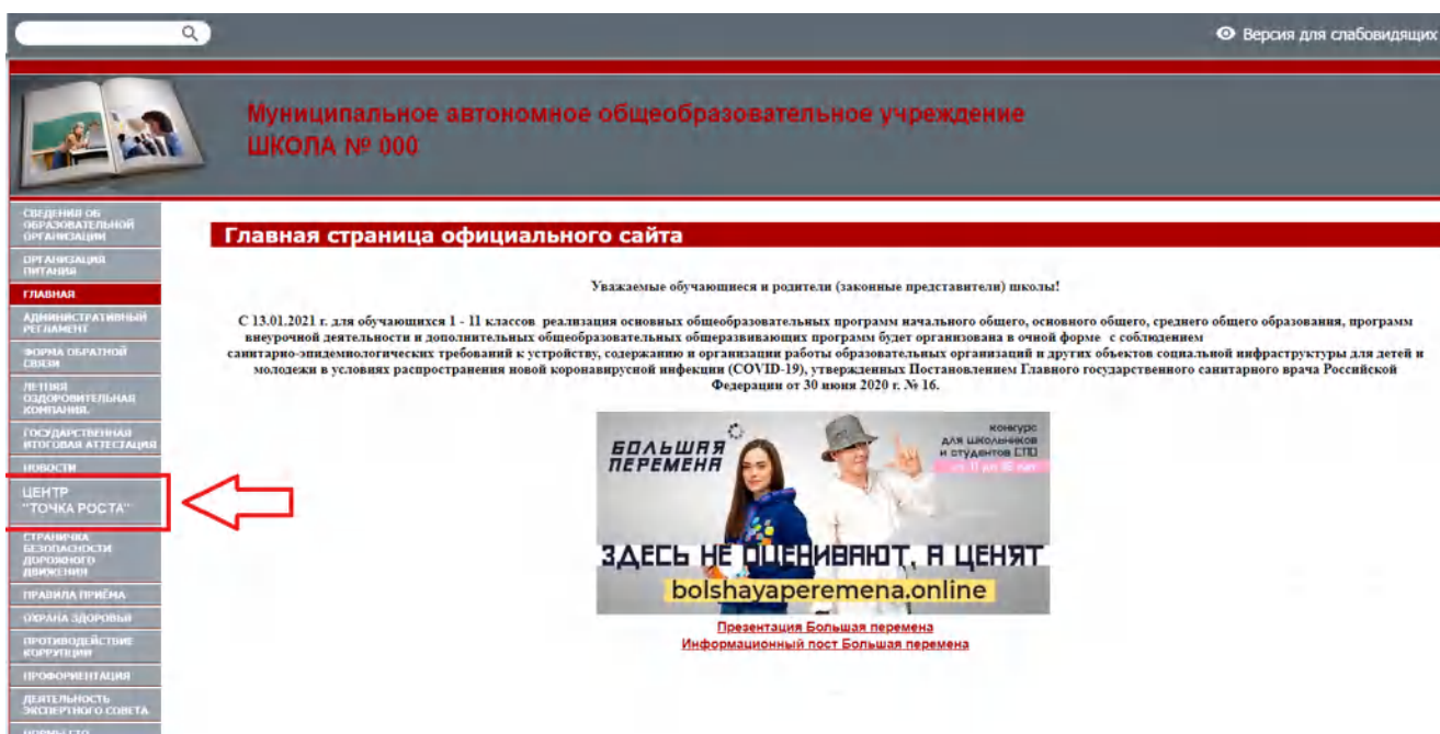
Рисунок 2. Пример размещения ссылки на раздел на сайте общеобразовательной организации

На официальном сайте общеобразовательной организации, в которой создается центр образования естественно-научной и технологической направленностей «Точка роста» (далее – центр «Точка роста», центр) в рамках федерального проекта «Современная школа» национального проекта «Образование», не позднее даты начала функционирования центра (не позднее 1 сентября года создания центра) создается раздел «Центр «Точка роста». Ссылка на раздел размещается в главном меню сайта общеобразовательной организации и должна быть видима при просмотре каждой страницы. Ссылка не может являться вложенной в другие меню. Пример размещения ссылки на раздел «Центр «Точка роста» в меню официального сайта общеобразовательной организации в информационно-телекоммуникационной сети «Интернет» приведен на рисунке 2.